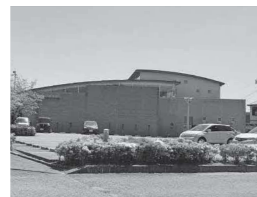
大津郵便局南側にあるおおづ図書館