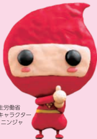
厚生労働省 給付金キャラクター カクニンジャ

申請書を紛失した場合や、住民税申告などにより新たに支給対象となった場合は、お問い合わせください。