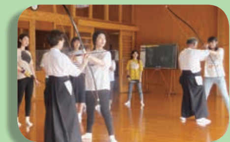
「日本人でもなかなかできない弓道体験ができて良かった」という感想が聞かれました

現在、いろいろな国から外国人旅行者が熊本を訪れています。町で日本の文化を体験してもらいたいという気持ちで町内の各種団体に外国人向けの体験プランができないか相談しています。その実現に向けて8月1日に尚絅大学の協力で、韓国と台湾から熊本にきている留学生と留学していた尚絅大学の学生、計8人に大津町で3つの体験に挑戦してもらいました。外国人目線の感想を聞き、体験プランの参考にするのが目的です。1つ目は弓道。大津町弓道協会の協力で2時間特別コースで28m先の的を射る体験。2つ目は下町の柿乃葉寿さんの協力で浴衣の着付け体験。好きな柄を選び帯と合わせ、着付け後、近くの白川河川敷をみんなで散歩しました。3つ目はツバキ折り紙会の指導で折り紙に挑戦。「鶴」と「手裏剣」の2つの作品の折り方を先生から教えてもらいました。