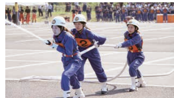
火点と呼ばれる的に向かって放水をする大津町女性消防隊の皆さん

第5回 熊本県女性消防操法大会が8月19日に人吉市の人吉スポーツパレス駐車場で開催されました。これは消火活動の基本的な操作習得のために行われており、放水で的を落とすまでの速さや正確さなどを競うものです。同大会には菊池郡支部代表の大津町女性消防隊をはじめ、県下から合計12チームの女性消防隊が集まりました。代表の女性消防隊の選手たちはこの日のために訓練に励み、操法を披露しました。