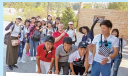
ネブラスカ州の動物園前

このコラムでは書ききれないほどの、たくさんのお話や写真がありますので、もし見たい人、聞きたい人がいればぜひ役場にいる私を訪ねてください。