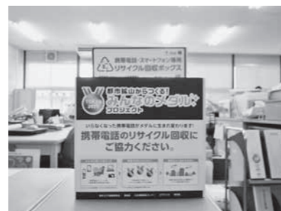
役場環境保全課の前に設置しています よろしくおねがいします

●都市鉱山からつくる！ みんなのメダルプロジェクト 2020年に東京で開催されるオリンピック・パラリンピック競技大会の入賞メダルに、使われなくなった携帯電話・スマートフォンに含まれる希少金属がリサイクルされることになりました。 町もこの取り組みに賛同し、役場環境保全課前に回収箱を設置しています。皆さんのご理解とご協力をよろしくおねがいします。 ※一度箱に入れてしまうとどんな理由があってもお返しできません。必ずデータの消去をお願いします。