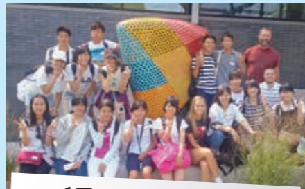
ヘイスティングズ大学前

今回のホームステイプログラムで、ようやく大津町の人を私のホームカントリーへ連れて行く事ができました。また、私にとっても初めての経験も多く、とても有意義なものでした。