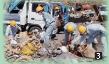
1無事に締結が終わり締結書を見せる家入町長(左)と大津市長(右) 2昨年の地震後4月19日早朝にいち早く大津市から支援物資が届きました 3大津市の派遣職員の皆さんは炎天下の中、災害置き場での災害ごみの分別作業を行っていました 4大津市の学校などからも多くの応援メッセージが寄せられました