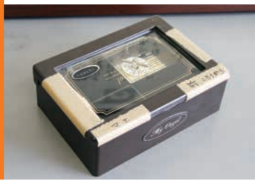
声の広報おおづのオープニングを奏でるオルゴール。地震で棚から落ちてしまい外箱は壊れてしまったが今も活躍をしている。