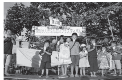
南杉水人権フェスティバル 出し物はフラダンスや歌など多種多様 毎年恒例のアイス早食い大会も大盛況