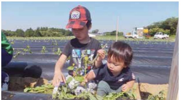
照りつける日差しの中、子どもたちも元気に植えていました