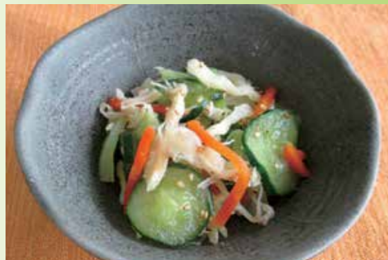
6月1日の給食献立 大津町学校給食センター

6月4日～10日は、歯と口の健康週間でしたのでかみごたえのある食材を使った献立を紹介します。日本人が昔から食べてきたものには、かみごたえのある食べ物が多くあります。「かむ」ということは、体にとってとても良い働きがあります。ぜひ、よくかんで食べてください。