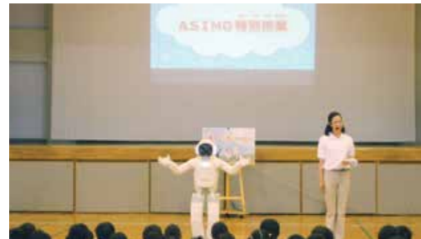
子どもたちに「夢に向かってがんばって」と語りかけるA S I M O

これは、復興支援の一環として実施されたもので、参加・体験しながらロボットのA S I M Oの仕組みや開発の歴史を学ぶことができる授業です。間近で動くA S I M Oに、子どもたちは興味津々。「ダンスが上手」「こんなに早く走れるなんて知らなかった」と拍手や歓声で会場は盛り上がりました。