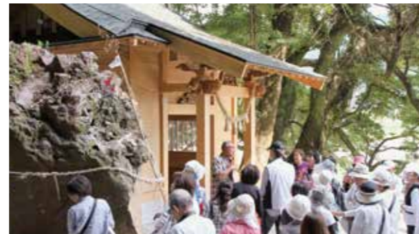
県文化財保護指導員からの説明に聴き入る参加者たち

これは、県が被災地の現状を知ってもらいたいと県外の観光客を対象に行っているツアー。瀬田神社、道の駅大津や南阿蘇村立野地区などを巡りました。瀬田神社に崩落した巨石をご神体としてまつることになった話など、県文化財指導員からの地区の説明に参加した人たちからは感嘆の声が漏れていました。