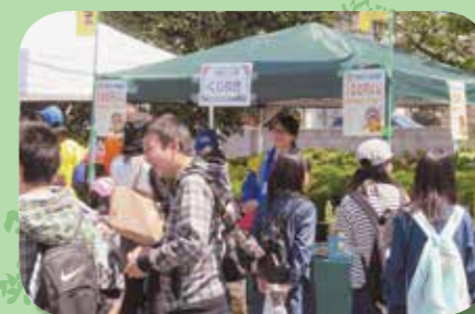
大津つつじ祭も大盛況でした