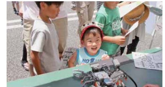
県立技術短期大学のブースのロボットに 子どもたちは大興奮

大津町、合志市、菊陽町、西原村の企業などを集めた企業E X P Oが6月4日、町生涯学習センター駐車場で行われました。これは子どもたちに地域で活躍する企業を知ってもらいたいと東熊本青年会議所が主催で行ったもので、乾燥野菜工場、農機具メーカーや医療機器メーカーなど地域を支えるさまざまな企業が出展しました。同日、文化ホールで「地域創生サミット」と題し、東熊本4市町村長らを集めた公開討論も行われました。