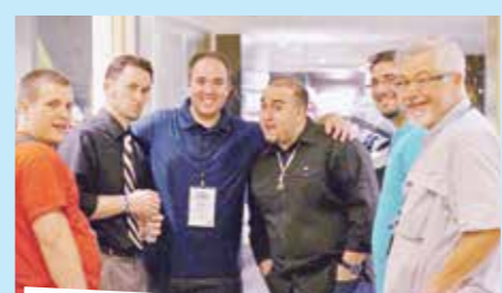
カナダのクワイアメンバー

私はこのクワイア(合唱団・聖歌隊)のアイデアについて、これまでも話してきましたが、いよいよ、少しずつ前進して行きます。興味あるあなたに、必要な情報がここに！！