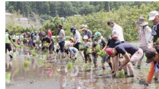
暑い日ざしの中、植えていく参加者の皆さん 水田にたまった水が浸透し地下水になります

参加者は「地震で去年は参加できなかったが、今年は参加できてうれしい」と笑顔でした。