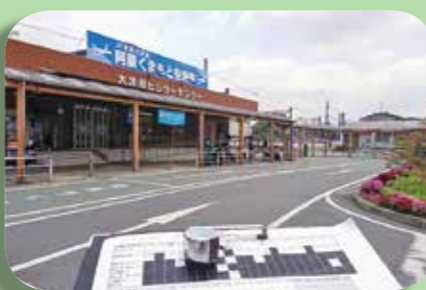
調査へのご協力ありがとうございました

皆さん、こんにちは！ あじさいの花が少しずつ色づき始め、梅雨の気配を感じる時期となりましたね。さて、前の話ですが3月に駅南側で初市が2日間開かれ、協力隊も焼き芋を販売し、来場する皆さんに振舞いました。その時に気付いたのが、南側でバスを待つ人の多さでした。現在、JR豊肥線下りは地震による影響のため肥後大津駅が終点です。阿蘇や大分方面に向かう人はJRの代替バスや「やまびこ号」「九州横断バス」で移動しています。また、高森町や南阿蘇村が通学用として運行しているバスなども停車し、上り下り合わせて1日あたり50本以上のバスが駅を発着しています(空港ライナーは除きます)。「これらのバスを待っている観光、通勤、通学、出張といったさまざまな目的を持っている人たちが時間毎にどの位いるのか？」を把握する事で駅前の活性化に向けた一つの資料となるのではないかと考え、去る5月5~11日の1週間にわたり、駅南側の滞留人口の調査を協力隊で行いました。バスや電車の乗り継ぎ時間に応じて、町歩き散策マップ、おみやげ、食事処のニーズを探りました。現在集計中ですが、さまざまな国の人が大津を訪れていることを知り驚きました。まとまり次第報告書を出したいと思っています。