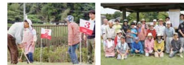
6月7日、環境美化作業のあと、鳥子川区のグランドゴルフ大会が行われました。参加した人は爽やかな汗を流していました。