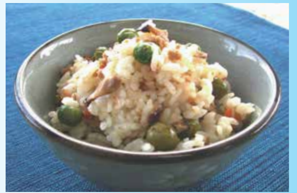
5月13日の給食献立 大津町学校給食センター

グリーンピースは初夏が旬の野菜です。さやから取り出すと実が堅くなりやすいため、旬の時期はさやつきのものを利用すると風味も味も増します。たんぱく質、ビタミンB群、ビタミンC、食物繊維などを豊富に含みます。特に食物繊維は豆類のなかでもトップクラスの含有量です。