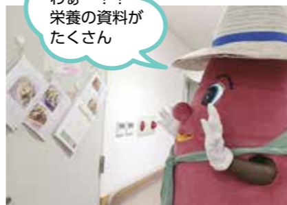
▲健診センター内には栄養に関する資料、健康づくりに関する資料などを展示