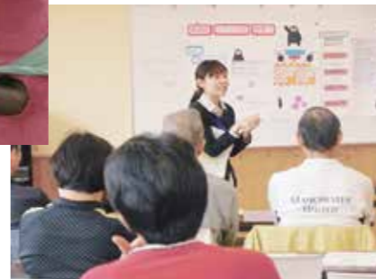
▼生活習慣病に関する教室の様子

また、子育て健診センターでは、生活習慣病予防教室や健康づくりに関する各種資料を配布していますので、ぜひご利用ください。