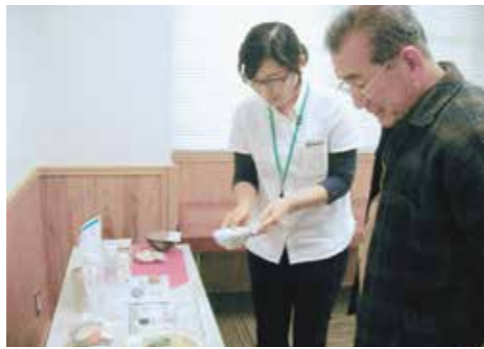
▲フードモデルを使用しながら基準量と普段の食事を確認中

以前、町の保健指導を受けた時の感想を話してくれました。「今まで気に留めていなかった検査結果の数値に関する内容が聞けた。加えて、これからどうしたらよいのか詳しい説明があった」さらに、健診結果はもちろん、家族も一緒に食事や運動について、気にかけるようになったそうです。