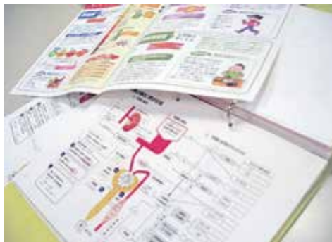
▲他にもさまざまな資料や学習教材を揃えています

「食事は朝・昼・晩それぞれ違うし、活動量も違う。一人ひとり違う中身に対応できて、目で見て分かる資料がいいと思う」と住民の立場から保健師・栄養士へのご意見もありました。また、健診についても、早期に動脈硬化が発見できるように検査項目の導入などの提案もいただきました。