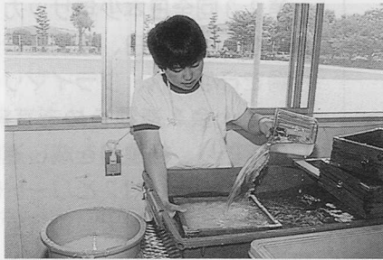
目標の400枚をめざしてがんばっています

制作者 大津養護学校高等部紙工班（室） 大津あゆみ園（室） 三気の里（森） つくしの里（平川）