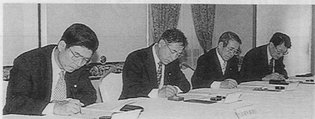
合意書にサインする四町村長

六月十一日、エアポートホテルで「公共工事からの暴力団排除に関する合意書」の調印式があり、大津署管内の大津、菊陽、合志、西原の四町村長が調印しました。