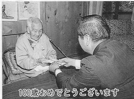
100歳おめでとうございます