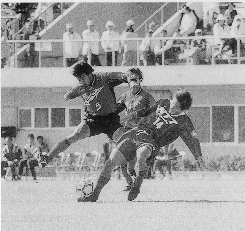
昨年のリハーサル大会決勝戦（NTTサッカー部 VS 北海道電力サッカー部）

とき 7月18日（日）午前7時30分開会（小雨決行 態度決定6時） ところ 大津町運動公園（スポーツの森・大津）