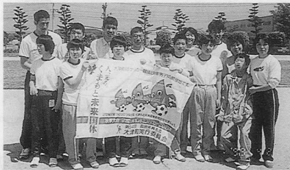
手作りの色紙をつくる大津養護学校高等部の皆さん

この色紙は選手が大会から帰郷した後、民泊した大津町から民泊の思い出（記念写真・民泊協力会の寄せ書き）をのせて、作成した施設のメッセージとともに届くという企画です。必ず大津町の温かい心が選手の皆さんに届くと思います。