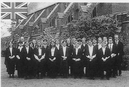
ケンブリッジ大学ガートン・カレッジ聖歌隊 Girton College Chapel Choir, University of Cambridge