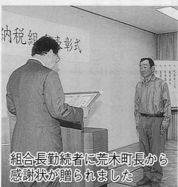
組合長勤続者に荒木町長から感謝状が贈られました