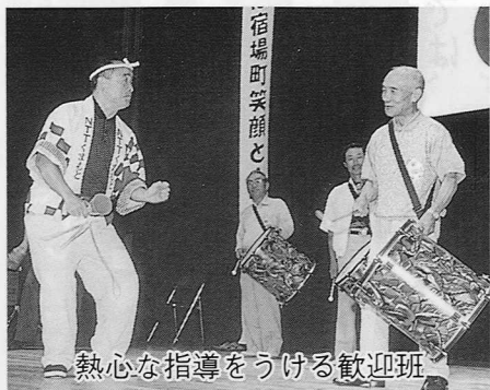
熱心な指導を受ける歓迎班

くまもと未来国体百五十日前を記念して、五月二十六日、町文化ホールで「民泊協力会歓迎班大集合」が開催されました。