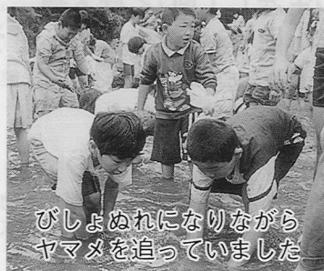
ながらにやまめを追っていた びよめを追っていた

山開きの神事のあと、木工教室や肥後牛の串焼きなどが行われ、家族連れやハイカーなどにぎわいました。