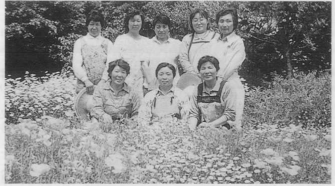
ユングフラウの皆さんがつくった花畑

制作者 大津養護学校高等部紙工班（室） 大津あゆみ園（室） 三気の里（森） つくしの里（平川）