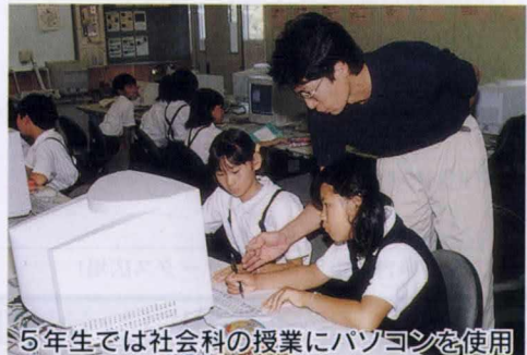
5年生では社会科の授業にパソコンを使用