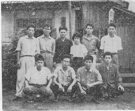
(写真は農事研修生です)

又私の住み込んでいた家でも言つておられた事は、將 来は四十頭飼育することが目標で一人で二十頭までは 可能だをうだ。なぜ四十頭が目標かといふと、一頭に 年間五割あつたら充分やれるので、ここは一町九反で