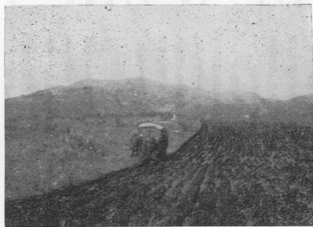
(写真は真木地区の起土作業を行つている処であります)

この事業が年々増加し進行に伴ひ現在野芝はぎ女竹等で繁り採草地でなかつた処が青々と栄養化の高い牧草が繁茂し家畜の戯れる光景がいたる処に見られると思ひます。皆様もう一度現地を見られる様にお奨めします。