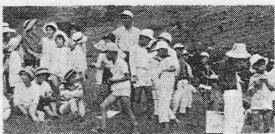
阿蘇へ……一日お父さん旅行

大津町社会福祉協議会では二十二日武田助夜を一日お父さんとして母子世帯の児童六十名母親五十名を仙酔峡からの阿蘇登山に招待した。