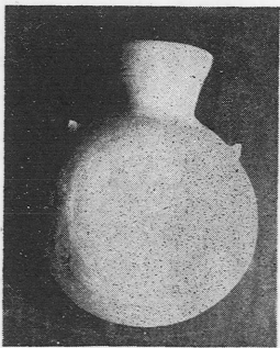
提瓶(ヤケベ) 上掲 本田誠一氏蔵