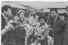
ただいま成人者調査中

本事業の目的である「町近代化農業の飛躍的な発展」をみなさんと共に期待したいと思います。