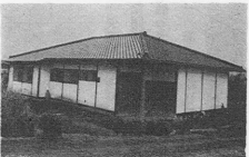
私連職員の念願でした職員寮を町からプレゼントして戴きました。こんな嬉しいことはありません。

四一坪 三八九万円 宇都宮建設 職員寮は創立以来の宿望でした。こんなニホードもあります。 開園当時のことですが町長さんをお話してお話し合いをしたことがあります。 或る職員が、「私達は二十四時間勤務です」と云いましたら、町長さんは「かえり「真女達はお休みになるでしよう」と大変イットに富んだことをおっしゃいました。 職員(保母は児童と起居を共にしています。若い身空で施設に泊り込むことは大変辛いことです。 自分の時間に保母室に居りますと児童が入り替り立替りノックします、果は疑きます。廊下を走る音、泣き叫ぶ声が聞えて来ます。 静養も休養もあつたものではありません。 職員にしますと、勤務の連続二十四時間間感覚に探われてしまいいます。 無理からんこととです。あれから随分と時が流れました。人も移り替りました。かつて園見だつた五〇余名が社会人として生産人として人の世で雄々しく立ち働いています。