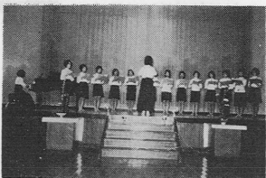
好評だった文化祭

習の成果を発表し好評を拍した。会場には生花教室、書道教室、大津小習友会、園工クラブの作品も展示され文化祭にふさわしい雰囲気を感じ上げた関係者では春秋二回この種の発表会を催し定期的なものにしたいといっている。