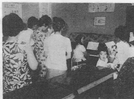
図書新刊入庫 ご利用下さい

熊古考古教室では七月二十六日より十日間発掘調査を行います。通称ワクト石は縄文晩期の居住地跡として学界では注目されているところです。