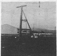
上鶴に試掘ボーリング

水源町住宅払下げ及び町道舗装については他 陳情七件、内三件は予算措置済みとなっており四件は採択の上執行部に送付決定 特に新小屋より出された敷圖書は敷額通り決定執行部の了承を得た。