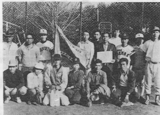
青年商工会議所主催ソフト大会優勝後迫チーム