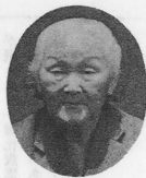
海外で働く人たち 4