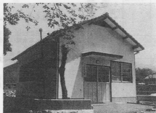
下中古閣公民館落成