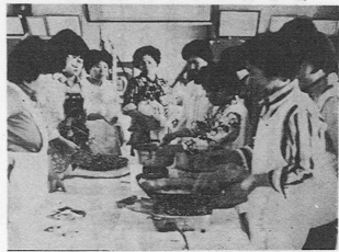
若葉会のイモかりん糖 テレビへ

小包又は十月十五日、年賀状は十二月二十日までにお出し下さい。郵便物のあて名は、くわしく完全に間違つたり不完全なあて名を置かれたために迷子郵便となるものが全国で一日約四十万通にも達しています。 「困地やアパート」あては「〇〇棟〇号」「〇〇アパート」あては「〇〇号」、子供さんや下宿、間借り、同居をされている方あてには、〇〇棟方の届書をお忘れなく。