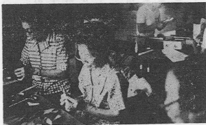
折る心が花の輪に

このように自分の持っているものを他の人たちの幸福のために役立てることを、みんんで育てていきたいと思いが、す。あなたのやさしい心づかいが、どれだけまわり明るく、楽しい光をあびさせるかも一度やりかえつて考えてみたいものですね。赤いつじに黄色のリボンをつけたこの一枝が、悲しい事故をなくすために役立つてくれることを祈ります。