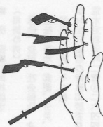
全国一せし集中取締り