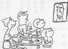
ガンマ線もあつちいりやんを健康がなすきたた