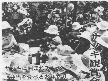
サツキに囲まれて弁当を食べるお年寄り