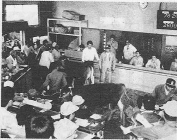
セリにかけられる赤牛の四つ子