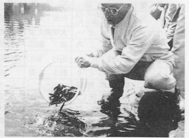
白川にアユを放流する漁協役員