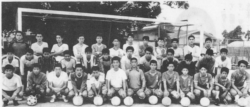
優勝した大津高校サッカー部