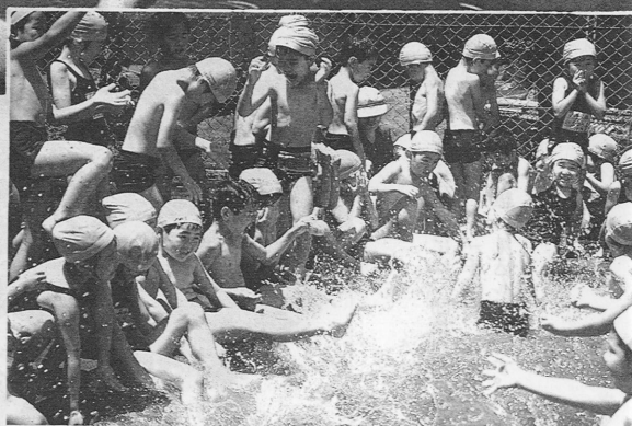
大津小1年生のプール開き（6月13日）