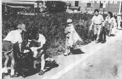
↑ゴミ拾いをする子供たち

環境週間期間中の六月五日〜六月十一日、町内一斉に環境美化・青少年一日一汗運動が行われました。 この運動は県内全域で実施されたもので、大津町でも子ども会、中・高校生、各事業所、各団体などから約六千人が参加。六月五日は、真夏を思わせる強い日射しの中、少しでもまをきれいにしてしようと、手に手にカマやゴミ袋を持って空きカンや紙くずなどのゴミ集めや草刈に快い汗を流していました。