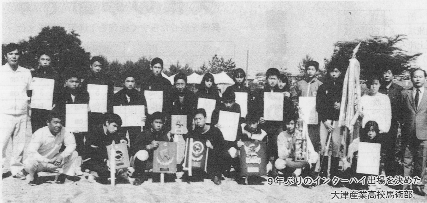
9年ぶりのインターハイ出場を決めた 大津産業高校馬術部