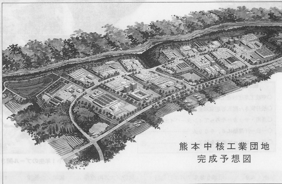
熊本中核工業団地 完成予想図

研究施設や人材育成のための施設の建設を計画しています。外にIC関連の企業進出が予想されており、七十五年の目標年次