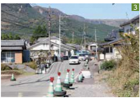
1_倒壊した拝殿(阿蘇神社) 2_崩落した阿蘇大橋と土砂崩れの跡(南阿蘇村) 3_地盤沈下で寸断された道路も現在は通行できる(阿蘇市)