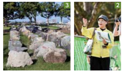
1_複数箇所ですら石垣が損壊(写真は戌亥櫓) 2_修復中の熊本城を案内するボランティアガイド 3_同じ位置に復元するため整理された崩れた石垣