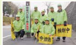
毎日、地域安全活動(通学路の安全確保)に取り組んでいる日吉ヶ丘ふれあい隊の皆さん

多くの地区で美化清掃をはじめ、各ボランティア団体などによる様々な取り組みが行われています。皆さんの善意の活動の数々が、大津町の元気へと繋がっています。