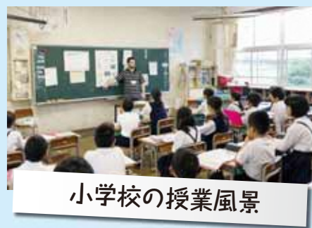
小学校の授業風景

さて、どちらが良いというわけではないですが、日本とアメリカの学校の仕組みを比べることも面白いです。そして、それを目の当たりにする、とても良い機会をもらいました。今年度から、小学校で「外国語」の授業が必須になり、英語の授業が3倍に増えたのです。