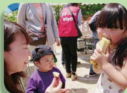
滋賀県大津市のイベントでも大津町のからいもは大盛況

他県のイベントを興味津々で盗み見しながら、「明日の観光大津を創る会」、「食生活改善推進員協議会」の皆さんといきなり団子や焼き芋をせっせと作り町のPRを頑張りました。徐々に長くなる順番待ちの列や、喜んで食べるお客さんたちの笑顔を見ていると、「やはり町のからいもは美味しいんだ」と再確認し、誇らしい気持ちになります。これを機に滋賀県にも「大津のからいも」が浸透しますように。