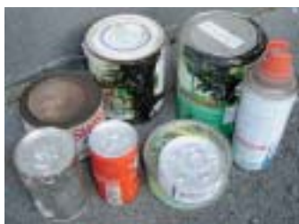
中身が入ったままの缶類。中身をきちんと取り除き洗って出しましょう(塗料缶は専門店に！)。