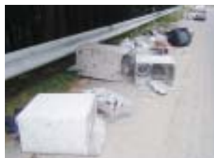
これらは、すべてガードレールを越えて山林に投げ込まれていました。