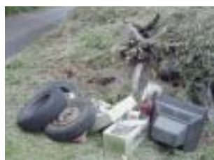
タイヤ・テレビなど処理費用が高いものが多量に不法投棄されています。

※「5年以下の懲役」か「1,000万円以下の罰金」となり、または併せての処罰もあります。