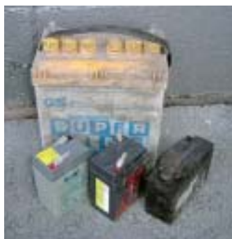
いろいろな種類のバッテリー類。これらは専門処理業者に持って行きましょう。

不法投棄のごみも、適正処理困難物も、ごみを出した当事者が自ら処分するべきものです。自分が出すごみは、責任を持って正しい方法で処分しましょう！