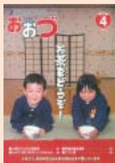
広報写真の部で入選した平成19年4月号の表紙「お茶をどうぞ!」

第51回熊本県広報コンクールで「広報おおづ」が町村の部で特選に選ばれ、全体のなかでのグランプリである熊口賞を受賞しました。