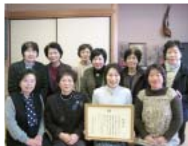
町更生保護女性会の皆さん

この程、町更生保護女性会に熊本保護観察所長から感謝状が贈られました。この感謝状は、更生援護と犯罪予防活動に貢献をした団体に贈られています。同会が募金と食材を持って更生保護施設に慰問したことが評価されたものです。おめでとうございます。