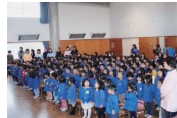
大きな声で歌いました