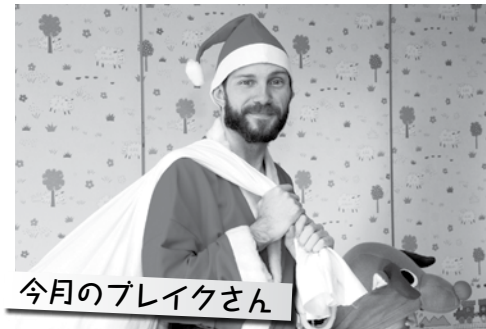
今月のブレイクさん

日本では、クリスマスは恋人とデートする日ですけど、アメリカでの25日は日本のお正月と似ていて、家族が集まり、おいしい料理を食べる日です。クリスマス・ケーキみたいなものもあるし、他のお菓子やケーキもあります。KFC ※には行かないけど。食事の後に、クリスマスツリーのまわりで、プレゼントを渡します。