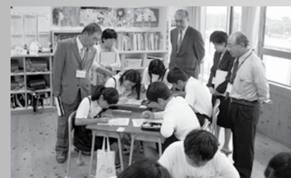
教育委員会による学校訪問