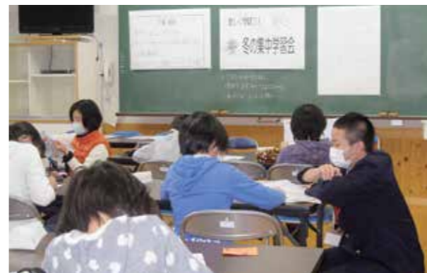
集中して勉強に取り組む子どもたち

学習意欲と学力の向上を目的に、昨年12月25日、26日の2日間、「冬休み集中学習会」を美咲野小学校で行い、93人の小・中学生が参加しました。学習支援指導員の先生や高校生ボランティアから算数・国語などを教えてもらいました。子どもたちは苦手克服のため、積極的に質問したり、後期後半に向けての予習に力を入れたりしていました。