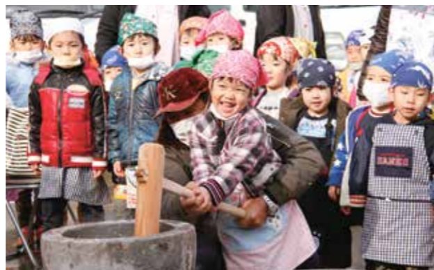
みんなで協力してついた餅は格別の味でしたよ

昨年12月20日、光進会3園(よろこび保育園、光進園、太寿園)と町農業委員会などによる合同餅つき交流会がよろこび保育園で行われ、約280人が参加しました。これは町農業委員会の耕作放棄地解消事業の一環として行われたものです。大人はもちろん、子どもたちも重たいきねを使って、一生懸命餅をついていました。