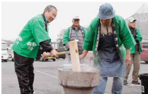
おいしいお餅のおかげで新年も元気に過ごせるでしょうね

昨年12月23日、大津町民生委員児童委員協議会による「第29回歳末チャリティ餅つき」が、町老人福祉センター前駐車場で行われました。できた鏡餅は元気に正月を迎えてもらえるようにと、70歳以上の一人暮らし高齢者のいる約550世帯に配られました。つきたての餅の販売もあり、収益は町社会福祉協議会へ寄付されました。