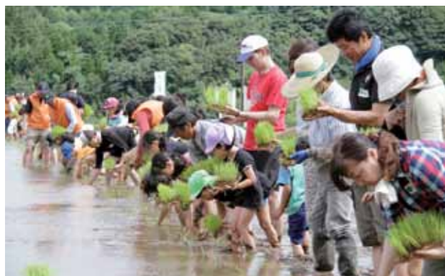
当日は天候にも恵まれ、約130人の参加者が田植えを楽しみました

6月29日、「田んぼの学校in白川中流域」が外牧地区の水田で開催され、大津町・熊本市の小学生とその保護者が田植えを体験しました。参加者は農業体験を通して、農業の大切さや地下水かん養機能など地元資源の持つ多面的な役割について理解を深めました。10月26日(土)には稲刈り体験も予定しています。