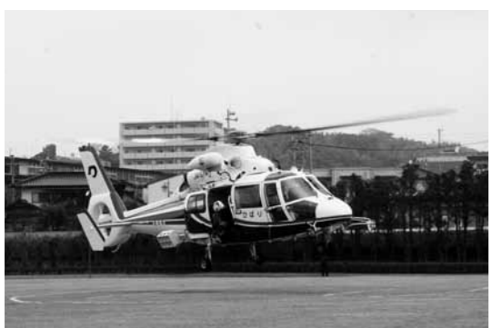
昨年の総合防災訓練には、防災ヘリコプター「ひばり」もやって来ました

大 きな災害が起こったときには、家屋や道路などの被害のほか、人的被害も大きくなることが予想されます。 町 ではこうした自然災害に備え、毎年総合防災訓練を実施しています。防災に関する知識だけでなく、いざというときに行動ができるように、皆さんの多数の参加をお待ちしています。 当 日は午前8時からサイレンを鳴らしますので、火災などとお間違えないようお願いいたします。 ▼日時 10月27日(日) 午前10時～正午 ▼場所 大津町中央公園