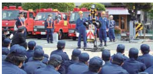
踏切内に車が取り残されたときの対応などを学びました