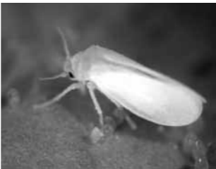
タバココナジラミ 成虫 (0.8mm)