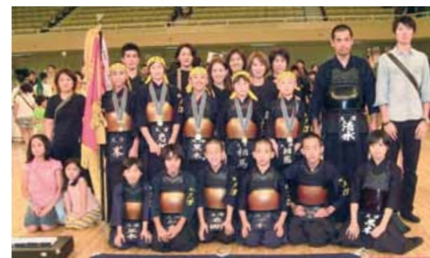
大津少年剣道クラブの皆さん、優勝おめでとうございます

「全日本少年少女武道(剣道)錬成大会」が7月29日、東京の日本武道館で開催され、大津少年剣道クラブが優勝しました。これは小学生剣道の全国大会で、武道を通して心身の錬磨と相互の親睦を図り、日本の将来を担う青少年の健全な育成を目的としています。この大会では試合の強さだけでなく基本の正確さも競われ、礼法も厳しく見られます。