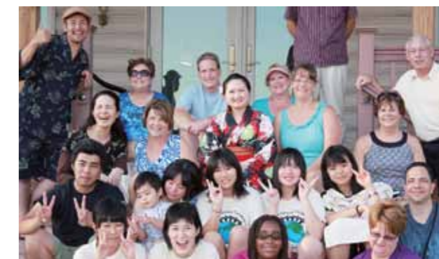
このホームステイをきっかけに、留学してみたいという希望をもった学生もいました。今後の活躍が期待できますね

7月21日~8月1日まで研修生として町の中高生6人が、姉妹都市アメリカ合衆国ヘイスティングズ市でホームステイをしました。9月3日に行われた報告会では、研修生たちは「食べ物が大きくてびっくりした」「英語が伝わらなくて困った」「ヘイスティングズ市の人たちはみんな優しくかった」など、異国の地でどんな経験をしてきたかを報告しました。