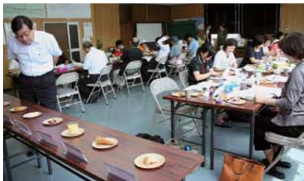
ここから未来の大津の新名物が生まれるかもしれませんね

大津町商工会特産品開発部会の第1回試食会が8月30日、大津町商工会館で行われました。町商工会は、平成24年度国直轄事業である「小規模事業者地域力活用新事業全国展開支援事業」の採択を受け、大津町の農産物を活用した特産品開発の調査研究事業に取り組んでおり、この試食会はその一環として行われたものです。当日は翔陽高校の生徒や地元の事業所が応募した作品16点を参加者が試食し、見た目や味などさまざまな観点から感想を述べていました。