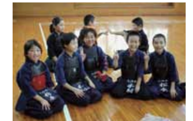
日本の小学生剣士たち