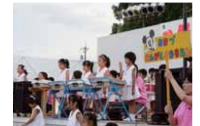
園児たちによる地蔵まつりでのステージ