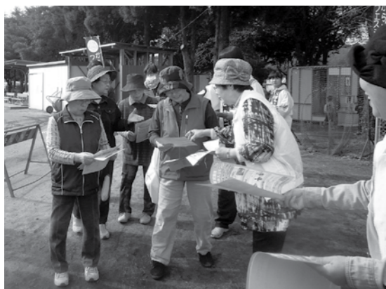
昨年のからいもフェスティバルでの啓発活動の様子

【問い合わせ】 町人権啓発福祉センター (役場人権推進課 人権推進係) ☎096(293)7920