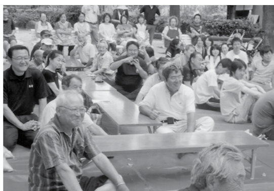
施設での訪問啓発

その他、町および近隣の市町村の人権フェスティバルなどでの啓発活動も行っています。 相談業務では、人権に関する相談のほか、悩みや各種の相談にも応じています。なお、相談内容については守秘義務を負っていますので気軽に相談してみてください。