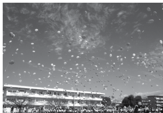
人権の花運動・風船飛ばし

私たちが人権擁護委員6人は大津町の推薦を受け、法務大臣の委嘱のもと、阿蘇大津人権擁護委員協議会(54人に所属し、大津地区(大津町・菊陽町・合志市・西原村)、阿蘇地区(阿蘇市・高森町・小国町・南小国町・産山村・南阿蘇村)の広いエリアで、人権に関する相談・啓発を行っています。 相談業務として、法務局阿蘇大津支局で月・水・金曜日、地域では特設相談所の大津町役場で6月・10月・12月に相談を受けています。 また、啓発活動として三部会を組織し、大津阿蘇地区で次のような活動を行っています。