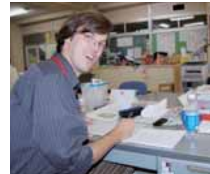
大津の皆さんありがとう

日本に来る前には、そのようなことをまったく期待していませんでした。また自身自身に問います。「どうやってそんな最高のことから離れられますか?」と。離れ難い気持ちでいっぱいです。