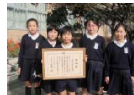
賞状を手にする室小の児童たち

昨年11月6日、「大津町民生委員児童委員協議会定例会」で室小に「平成21年度ボランティア功労者に対する厚生労働大臣感謝状」が伝達されました。同校は、平成12年度以降、県や町のボランティア協力校の指定を受け、近くの施設訪問などボランティア活動を通じて、福祉教育の推進、児童の育成に力を入れています。