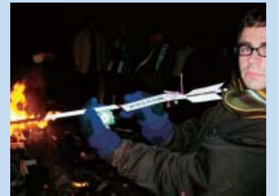
去年の初詣。今年も行きますよ。