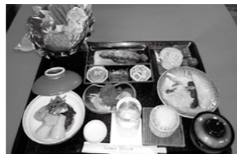
北海鍋味噌仕立て

・家族湯の入浴料が、通常は50分1,500円のところ、 木曜日は50分1,000円になります。