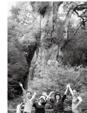
屋久島の自然を満喫しました! 楽しかったです!

屋久島ではいろいろな体験をし、素晴らしい時 間を過ごすことができました。わたしはますます いろいろな所に旅行したいです。