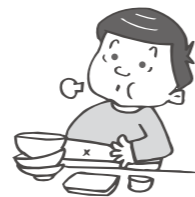
いつも満腹になるまで食べる