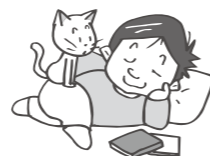
休みの日はゴロ寝をして過ごす