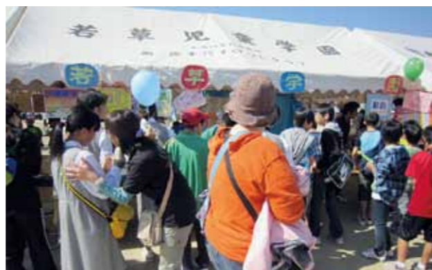
晴天の空とカラフルな色で祭りが更に彩りました

第12回福祉まつりが、10月17日、オークスプラザ周辺を会場に開催されました。当日は約4,000人の皆さんが来場し、福祉への理解を深めました。会場では、各種表彰や展示、安価での模擬店やバザー、ステージ発表などが催され、多くの来場者でにぎわいました。