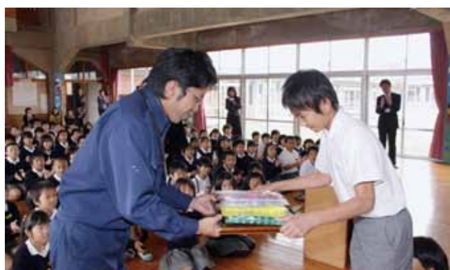
ごみ袋の寄贈は児童たちが見守る中に行われました。地域がもっときれいになっていくことを期待します

(株)グリーンロジスティクス(杉水)が11月11日、護川小にごみ袋を寄贈しました。同社がボランティア活動を行ってきたことで得た地域通貨「水水」を活用して、ごみ袋に交換。地域のために何かをしたいとの思いが今回の寄贈につながりました。「パトロールなどの活動で見る子どもたちの笑顔が、わたしたちの元気の原動力になります」と2年間の活動分で交換した31袋のごみ袋を渡しました。