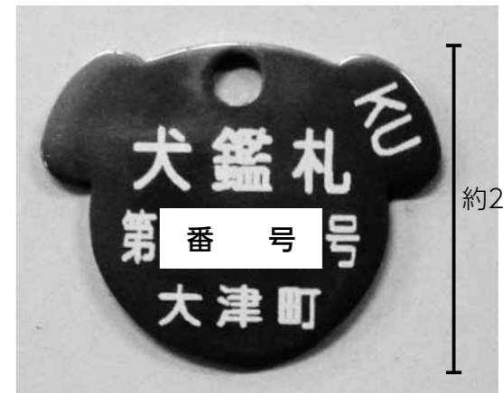
約2.5cm 大津町の鑑札 必ず首輪に装着してください

写真の鑑札をよく見ると真ん中に番号が表示されています。この番号は犬の登録番号を示すもので、もし犬が脱走して捕獲された場合などに登録番号から所有者が分かるため迅速に迷い犬をお返しすることができます。 また、狂犬病の予防注射をした際に交付される注射済票も装着が義務付けられています。 犬の登録と狂犬病予防注射(年1回)、交付された鑑札と注射済票の装着は狂犬病予防法で定められた飼い主の義務です。もう一度、飼い主の責任として確認をお願いします。