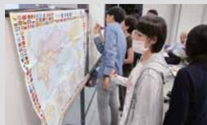
運営団体：大津町国際交流協会

ねらい 国際交流に興味や関心のある人を対象に、町内に在住外国人との意見交換や外国料理の体験、町内名所ツアーなどを通じた外国人とのふれあいなど、身近な異文化交流体験から国際交流の輪を広げる。