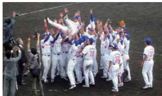
本戦出場が決まり、胴上げをする選手たち

「第83回都市対抗野球大会九州地区予選」が6月2日～9日に福岡県で開催されました。大津町代表ホンダ熊本は、第二代表決定トーナメント決勝で九州三菱自動車を12対0で下し、九州地区第二代表として本大会出場を決めました。都市対抗野球大会本戦は、7月13日(金)から東京ドームで開催され、ホンダ熊本の第1試合は7月18日(水)に行われます。応援よろしくお祈りします。