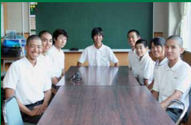
大津北中学校生徒会の皆さん

大津北中学校が「北中人権五カ条」を作ったのは、今から2年前です。きっかけは、大津北中学校を訪問した小学生の「大津北中学校にはじめはありますか」という質問に、自信を持って「無い」と答えられなかったことでした。そこで、当時の生徒会が中心になって「北中人権五カ条」を作り、いじめ根絶に取り組みました。現在の生徒会もその取り組みを引き継ぎ、年間を通していじめ根絶に取り組んでいます。「北中人権五カ条」は、人権委員会が廊下や各教室