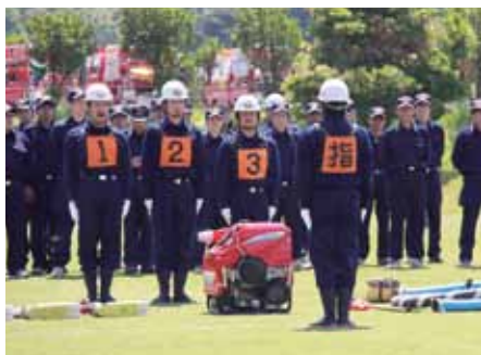
どの班も訓練の成果を遺憾なく発揮しました