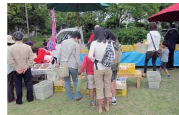
朝早くから、大勢の人が集まりました

5月20日、美咲野中央公園で初めての軽トラ朝市が開催されました(町商工会主催)。当日はあいにくの天気でしたが、もちやぜんざいの振る舞いや大津太鼓の勇壮な演奏に多くの人が集まりました。来場した人たちは軽トラ1台程度の即席のお店を次々のぞき込んで、農産物やお菓子、生花などを購入していました。