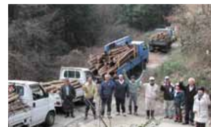
運営団体：OZUげんき塾

ねらい 水力、風力、太陽光、バイオマスという4つの自然エネルギーに恵まれた大津町の地理的特質を、現地を見学しながら学ぶ。また、それら潜在的エネルギーを実際に電気や燃料に変えるための「最適技術」や「導入方法」を、先行事例や業界リーダーの話を変えながら学んでいく。