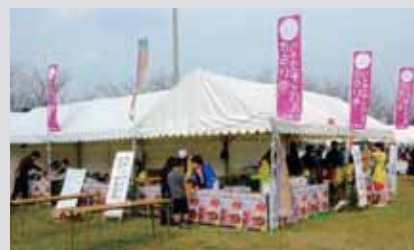
運営団体：明日の観光大津を創る会

ねらい 大津町のイベントのおもしろさを体験し、「大津大好き人間」になってもらう。