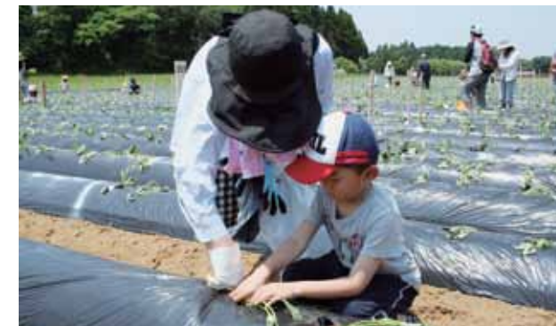
からいも掘り大会でまたお会いしましょう!

5月27日、からいもの苗の植え付けに約500人のからいもオーナーが集まりました(明日の観光大津を創る会主催)。初めてからいもを植える人や10年以上オーナーを続けている人などさまざまですが、みんなにぎやかに苗を植えていました。植え付けの後はJA甘藷部会が大事に育て、オーナーは自分で植えたからいもを秋に開催される「からいもフェスティバルinおおづ」で収穫します。