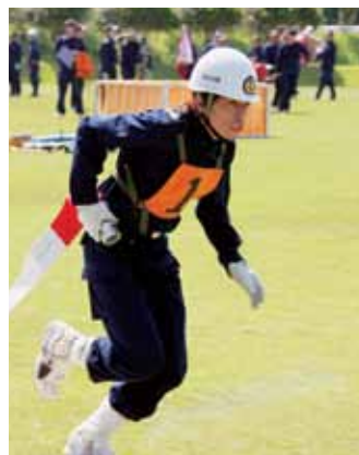
実践さながらの演技でした