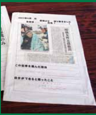
震災関連の記事を選び、自分の思いや考えをまとめて張り出した

興のために、募金活動、震災関連の新聞記事の切り取りなどを行いました。選択家庭科の授業では、手作りスクールバックやシューズ入れなどを作り、被災地に寄付しました。 被災地の復興を支援することは、被災地の人々を大切にすることです。それは、身近な人を大切にすることにもつながります。自分の隣にいる人を大切にして、支え合っていくことが大事なのだと思えることができれば、「北中人権五カ条」も意識でき、いじめをなくすことにもつながるのです。 今後は、環境委員を中心に、学校内の畑でからいもを作り、福島に届けることも計画しています。 「北中人権五カ条」の中でも掲げられている「仲間作り」という言葉。しかし、その言葉を実際の行動に移すのは、とても難しいものです。次のページでは、今年3月に発行された「人権作文第34集かいほう」の中から作文「本当の仲間」を紹介いたします。