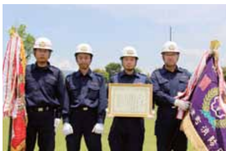
優勝した第3分団第2班の皆さん