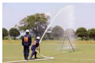
「火点」と呼ばれる的に向かって放水し、倒れるまでの早さを競います