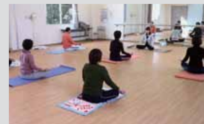
運営団体：クラブおおづ

ねらい ①クラブおおづの事業に参加し、自分の心と体の健康について考える。②固定観念にとらわれず自由な発想を養い「ユーモア性」を磨く。③性別・年代を超えて交流しコミュニケーション能力をアップさせる。