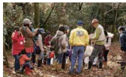
運営団体：非営利団体 野遊び体験活動研究会

ねらい 町内の森林公園や里山などの地域の自然とふれあいながら、将来地域で活躍する自然体験活動リーダーを目指す。