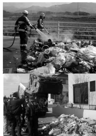
スプレー缶で発生した火災 その他の多くのごみが燃えてしまっている

原因は、不燃ごみ袋の中に中身の入ったガスボンベ缶が入っており、それが発火した可能性があります。これは非常に危険であり、人命にかかわることです。スプレー缶などは必ず中身を抜いてから資源ごみ回収の日に出すよう、分別の徹底をお願いします。