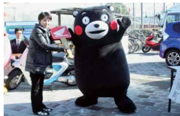
大津町からは7人が参加し、くまモンからゴールドキーが手渡されました。実験は3月8日まで、約1カ月間行われます

2月3日、次世代モビリティ社会性実証実験のパーク＆ライドのスタート式がビジターセンターで開催されました。これは、低炭素社会の実現に向けて本田技研工業(株)熊本製作所で生産している電動二輪車を活用し、肥後大津駅を利用してもらう取り組みです。電動二輪車はビジターセンターで太陽光により発電している電気から充電します。