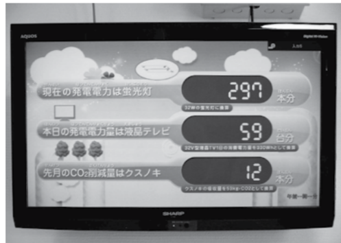
発電モニターを見ると、現在の発電電力が蛍光灯何本分に相当するのかなどが分かります

子育て・健診センターは、平成23年2月に「平成21年度地域新エネルギー等導入促進対策補助金」および「平成22年度九州グリーン電力基金」助成制度を利用して太陽光発電設備を設置しました（太陽光パネルの最大出力は10kW）。 センターでは入り口に発電モニターを設置し、現在の発電量やCO 2 の削減量などを来館者の皆さんに常時表示しています。 発電した電力は、主にセンター内の電灯に使用しており、電力の削減に役立っています。このように、町では環境保全意識の高揚と地球温暖化防止に貢献する取り組みを進めています。