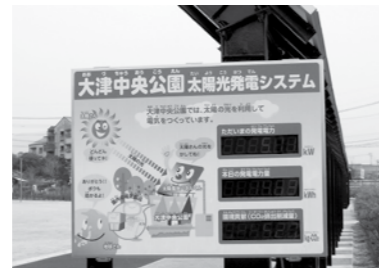
大津中央公園の太陽光発電量を表示しています