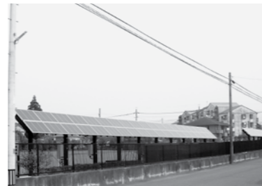
大津中央公園に設置した太陽光発電パネル。公園内の街灯の半分の電力を賅っています