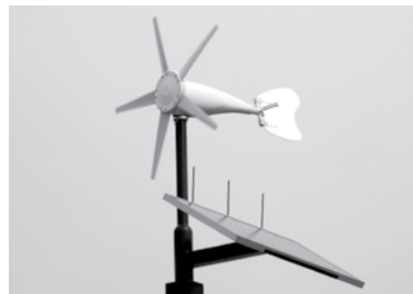
風力と太陽光で発電した電力を街灯の電力にしています