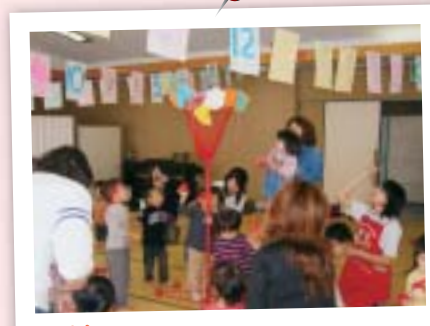
秋(運動会) お部屋で大運動会