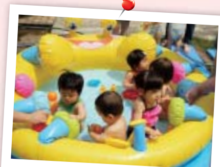
夏(プール) プール遊びは大人気！