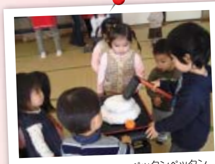
冬(もちつき) ベッタンベッタン おもちつき