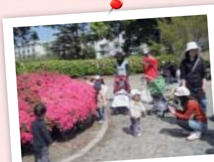
春(お散歩) 昭和園へお散歩♪