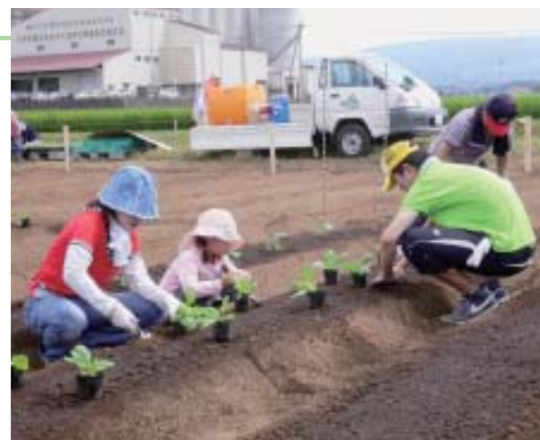
おいしい野菜できるといいな♪