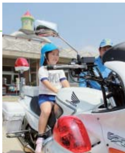
園児たちは大津警察署の白バイやパトカーに乗せてもらい、とってもゴキゲンでした