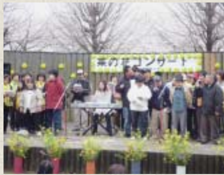
毎年開催している菜の花コンサート

登録団体紹介 「出会い・ふれあい・ひとづくりの輪」をキーワードに女性のパワーで元気なまちづくりを進めよう、平成6年に設立し今年で16年目を迎えました。18の女性グループが参加し会員数は約1,000人です。普段はそれぞれの活動をしていますが、長年培った知恵をまちづくりに生かしたいというんな団体と協力し合って楽しく活動をしています。