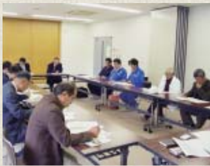
先進地研修も行っています 人吉市体育協会での研修の様子

一言PR 日頃から、町内のあらゆるところで21の種目団体が活動しています。活動に参加したいと思われる人は、ぜひご連絡ください。 問い合わせ 大津町体育協会事務所（町総合体育館内） ☎(093)300000 http://www.town-ozu.kumamoto.jp/guide_shougai_sports_kyokai