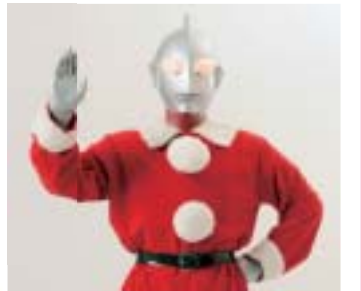
ウルトラヒーローセンター ©円谷プロ

イルミネーションは12月28日（月）まで点灯しています。（午後5時ごろ～午後7時）