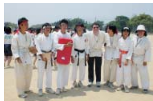
部活動紹介で空手部の皆さんと

いろいろな競技がありましたが、中でもタイヤ引き(*)は特に興味深かったですね。三人対一人でもう勝負がつくちょうどその時、一人で頑張っていた生徒のチームメイトが助けに入る、また、互いに力が張り合っていると